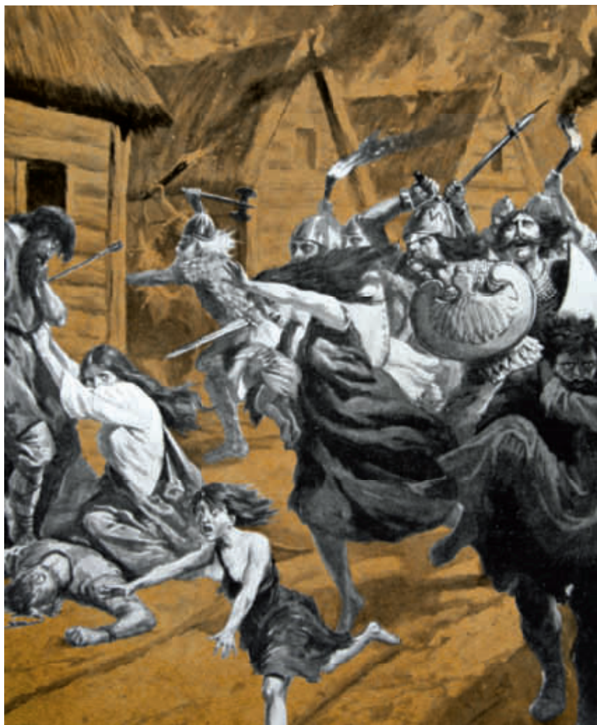
Vikingerne drog plyndrende gennem England. I 839 nåede de Canterbury.

En af de sidste trusler mod England kom i 950'erne i form af kong Erik Blodøkse af Norge. Han gjorde to forsøg på generobre Northumbria, men blev fordrevet og senere myr-