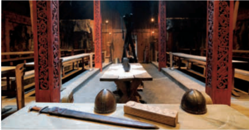
Kong Hrodgars hal i Heorot – formentlig Lejre i Danmark – er scenen for Beowulfs beretning om sine bedrifter. Den kan have lignet denne rekonstruerede festhal i Bøstad Borg i Norge.