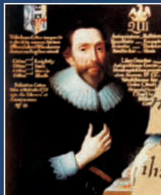
Sir Robert Cotton sikrede Beowulf-manuskriptet, som overlevede en biblioteksbrand.

Forskerne går ud fra, at historierne blev medbragt af germanske stammer – angler, saksere og jyder – som invaderede de britiske øer fra 400-tallet.