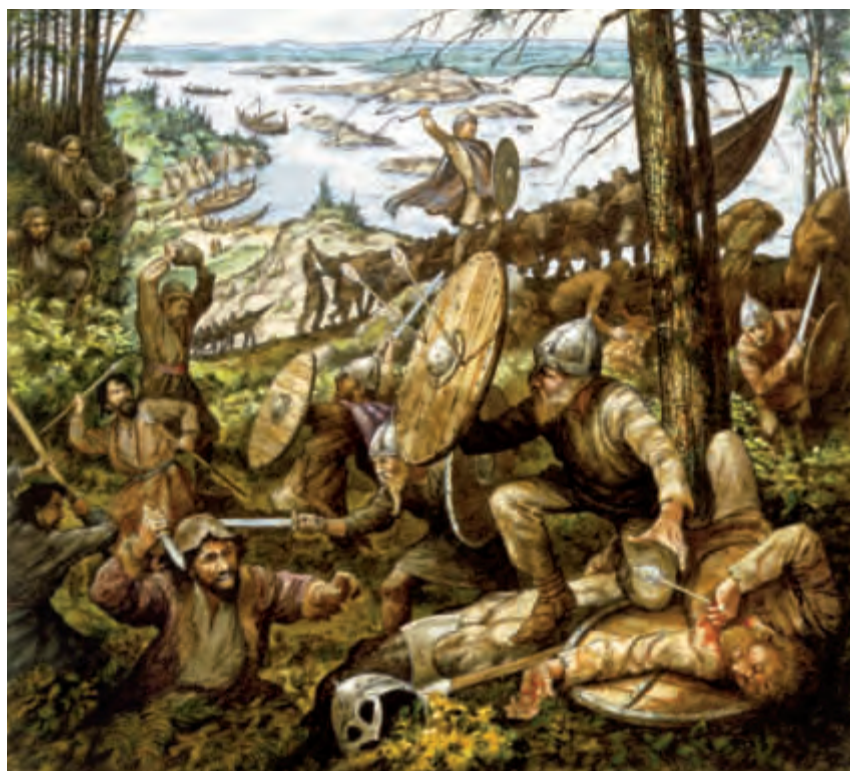
I 1122 kæmpede byzantinerne imod et tyrkisk rytterfolk i nutidens Bulgarien. Kampene var tætte og blodige, men da kejseren satte væringerne ind, gav tyrkerne op og flygtede.

• www.deremilitari.org/resources/articles/haldon2.htm