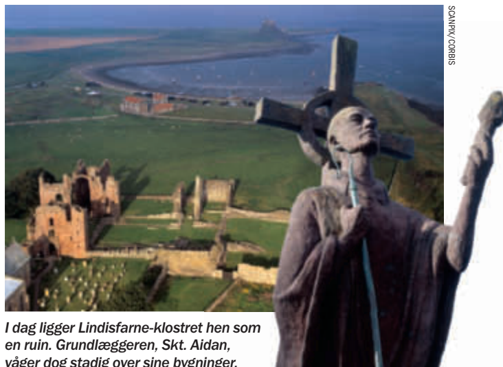
I dag ligger Lindisfarne-klostret hen som en ruin. Grundlæggeren, Skt. Aidan, våger dog stadig over sine bygninger.